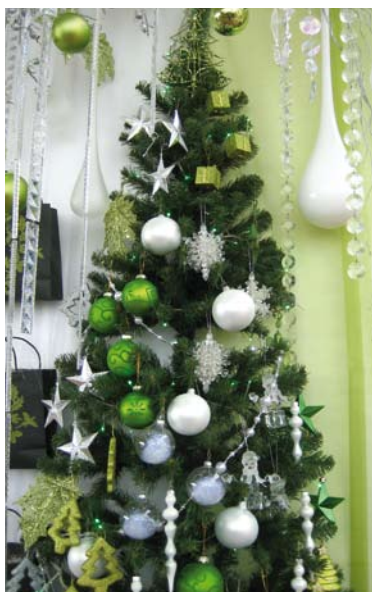
Un mélange de styles pour une décoration sobre et élégante (Plantes Assistance - Rungis).

ble de choisir un fond, en papier ou en tissu. Une gamme de papiers bicolores, de tissus non-tissés, d'organzas imprimés, d'imitations fausse fourrure blanche/noire, de cellos avec motifs sont actuellement disponibles à l'achat. Selon une professionnelle de la décoration : « Il ne faut pas hésiter à jouer avec les drapés ainsi qu'avec les tissus pailletés et l'organza qui créent une source de luminosité supplémentaire ».