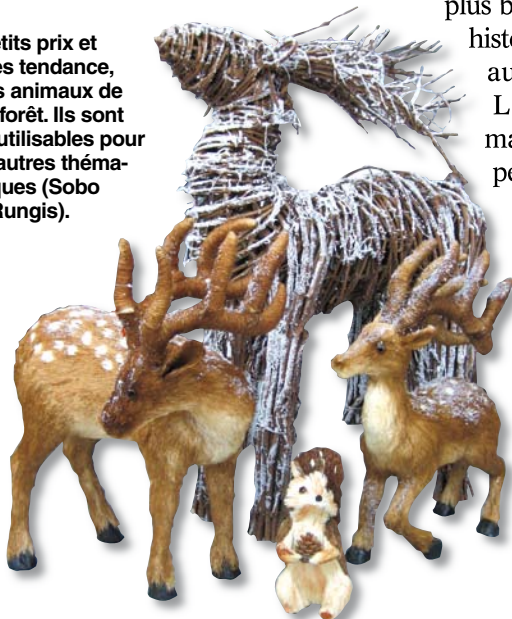
Petits prix et très tendance, les animaux de la forêt. Ils sont réutilisables pour d'autres thématiques (Sobo - Rungis).

Suspendus au plafond, accrochés aux branches d'un sapin ou parsemés dans votre vitrine, les angelots, étoiles et flocons phosphorescents pourront scintiller dans la nuit. Afin de mettre en valeur votre décoration, il est indispensa-