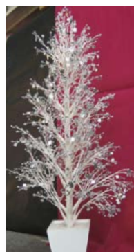
Original, le sapin de Noël blanc-argenté incrusté de mini-miroirs ronds et carrés (Feuillazur-Rungis).