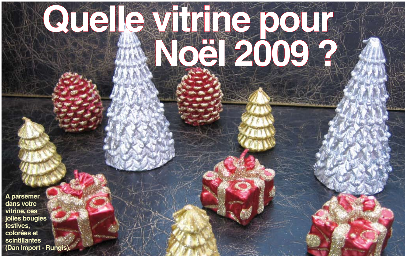
A parsemer dans votre vitrine, ces jolies bougies festives, colorées et scintillantes (Dan Import - Rungis).

C'est le moment de penser à votre vitrine pour les fêtes de fin d'année. Accessoires décoratifs, matières tendance et règles d'esthétisme : comment assurer le succès de votre décoration.