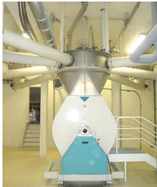
Cet équipement ultra performant a fait passer le temps de mélange à 90 sec au lieu de 10 min !

Parmi les dernières nouveautés lancées après Premium (préparation pour la fabrication de viennoiseries maison) : un mixe aux noix ou l'anti-cloques Arliss'. « Nous travaillons aussi beaucoup sur la nutrition et le goût » précise-t-elle. Pour Banette, tous ces efforts participent d'un même élan pour la promotion de l'artisanat... « avec des professionnels bien inscrits dans la vie